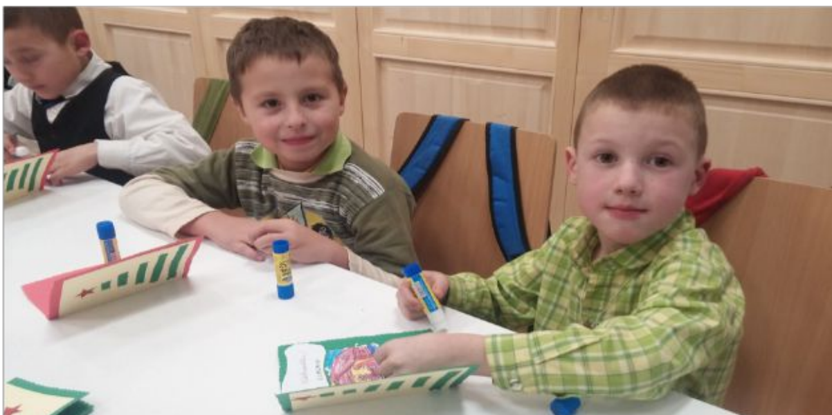
Abb. 4 Die Hausaufgabenbetreuung und Freizeitgestaltung wird von den Kindern sehr geschätzt