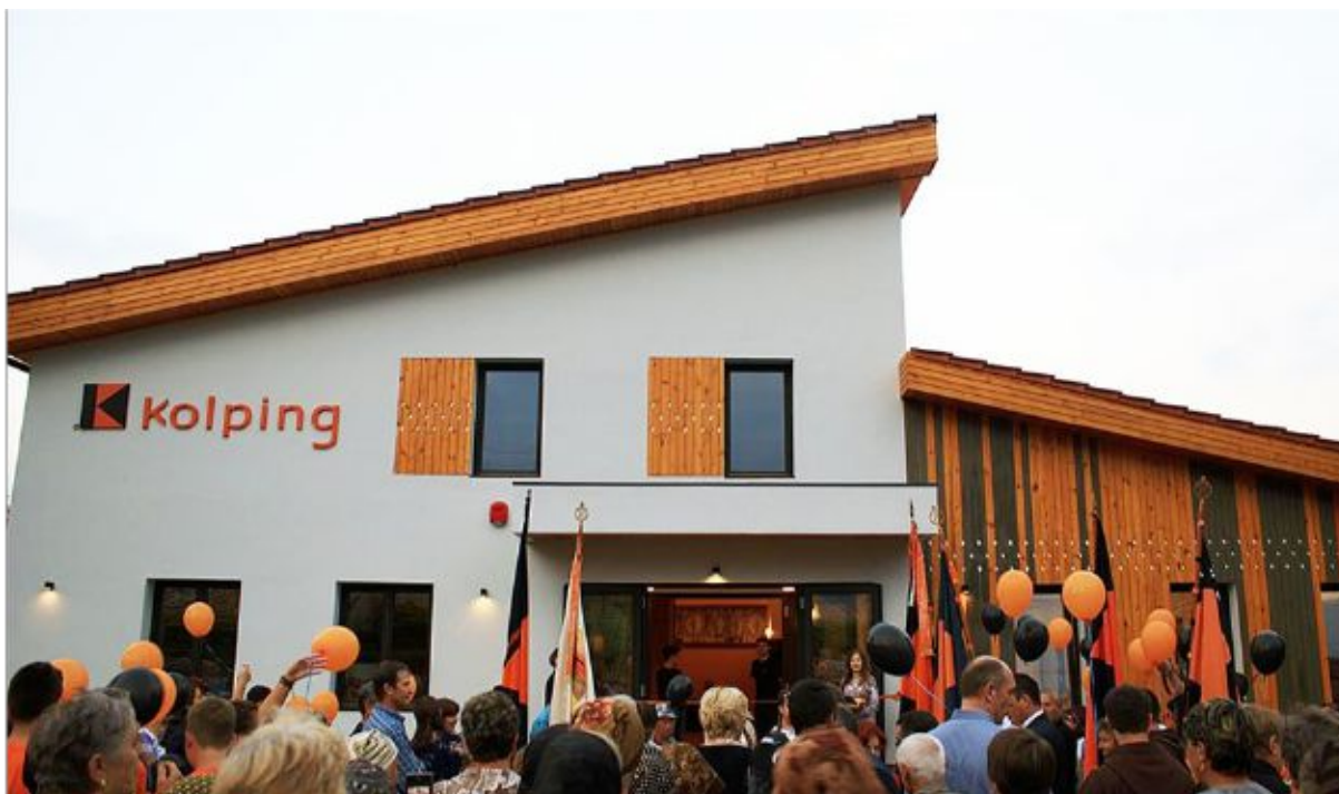
Abb. 2 Das Tageszentrum von Oituz bietet Schutz und Perspektive für eine bessere Zukunft

Die Kolpingsfamilien vor Ort bemühen sich, den negativen Folgen der Migration entgegenzuwirken und durch attraktive Angebote die Lebensqualität in der Region zu steigern. Das langfristige Ziel ist durch soziale und auch ökonomische Angebote den Menschen eine Perspektive zu bieten, so dass sie nicht gezwungen sind, ihre Heimat zu verlassen.