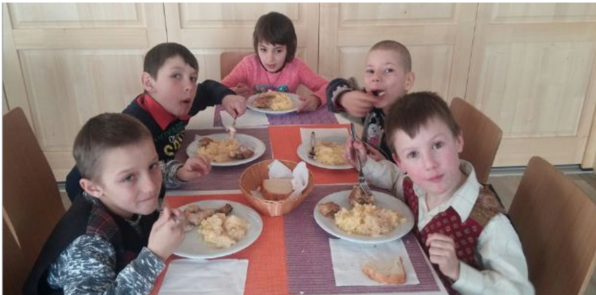
Abb. 3 Eine warme Mahlzeit am Tag ist für viele Kinder in Rumänien leider keine Selbstverständlichkeit

Daneben gibt es drei grosse Projekte, die gewinnbringend arbeiten müssen, um die Sozialprojekte und die Verbandsinfrastruktur finanzieren zu können. In Brasov gibt es dazu ein grosses Hotel, das praktisch nur mit Auszubildenden arbeitet. Das Hotel ist auf Tagungen, aber auch auf Tourismus ausgerichtet. Auch hier gibt es einen Anteil geschützter Arbeitsplätze. In Temeswar betreibt Kolping ein Bildungsinstitut mit Ausbildungsprogrammen in den Bereichen Sprachen, Computer und Betriebswirtschaft und eben das Tagungshaus in Oituz.