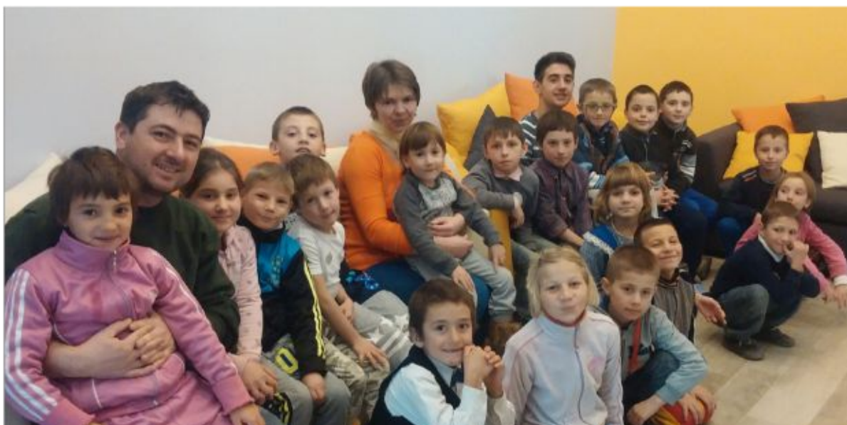
Abb. 1 Im Tageszentrum von Oituz finden Kinder und Jugendliche Gehör für ihre Anliegen